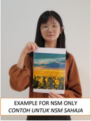
EXAMPLE FOR NSM ONLY CONTOH UNTUK NSM SAHAJA